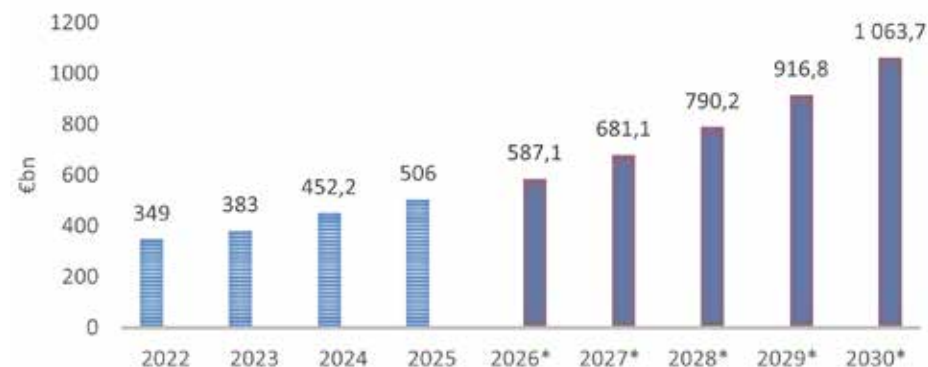
1. ábra: A Világbank becslései és előrejelzései Ukrajna újjáépítését illetően (milliárd euró).