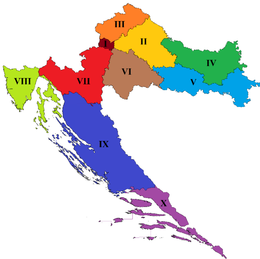
2. ábra. Horvát választási körzetek

A választási körzetek elhelyezkedését az 1. számú térkép illusztrálja. A XI. választókörzet a határon túli horvátokat fedi le.